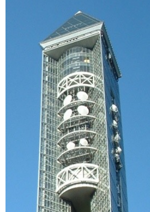
アンテナデッキに設置されたパラボラアンテナ